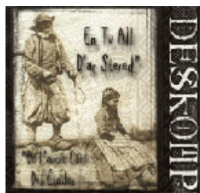
En Tu All D'ar Stered "De l'Autre Côté des Étoiles" enregistré en 1999 à l'A.D.O de IX.