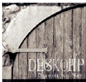
Digorit an Nor "Ouvrez la Porte" enregistré en 2001 à la MJC de Palaiseau